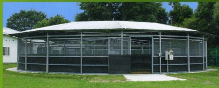
競走馬用ウォーキングマシン

天然芝が敷き詰められ手入れの行き届いた検査場敷地内には整備された41頭の馬房をはじめ、競走馬用ウォーキングマシンなどの充実した設備が整っております。